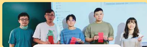
1131學期專家學者講座