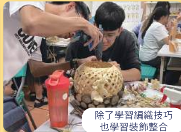
除了學習編織技巧也學習裝飾整合