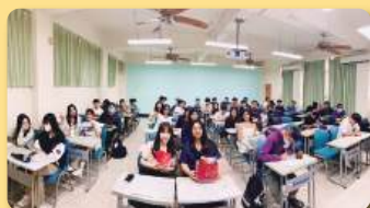
1122學期 專家學者講座