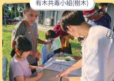
有木共毒小組(樹木)