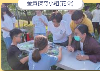
金黃探奇小組(花朵)