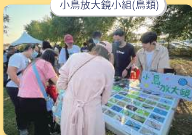
小鳥放大鏡小組(鳥類)