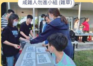
咸雜人勿進小組(雜草)