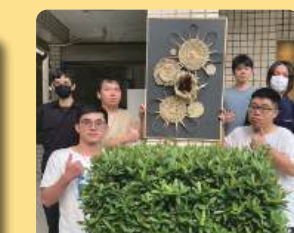
利用玉米葉做線性編織 以纏繞手法成型 用編織藝術妝點一面牆